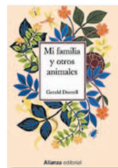
'MI FAMILIA Y OTROS ANIMALES' GERALD DURRELL Editorial. Alianza Editorial (1956)

L eer es quizás una de las mejores formas de salir de lo cotidiano y escapar de la realidad. El libro 'Mi familia y otros animales' del escritor y naturalista Gerald Durrell me ha salvado en las tardes lluviosas y grises de Bruselas. Durante los años treinta, una familia pintoresca de origen inglés, los Durrell, se mudan a la isla griega de Corfú, donde el hijo pequeño empieza a explorar la isla y sus animales, y la familia vive todo tipo de aventuras y desventuras. Es una novela muy luminosa, llena de anécdotas divertidas y sobresale por su capacidad de descripción de los personajes y de los paisajes salvajes de Corfú y de sus animales, que es lo que acaba atrapando al lector».