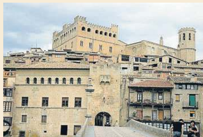
Imagen de Valderrobres