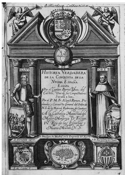
Imagen de la edición original de 1632

Esta versión de ‘Historia verdadera de la conquista de la Nueva España’ se basa en el texto establecido por Guillermo Serés en su edición para la colección Biblioteca Clásica de la Real Academia Española (2011). Dicho texto crítico se apoya, a su vez, en el llamado manuscrito de Guatemala, una copia de la obra restaurada en 1951 que hoy se considera, por la mayor parte de la crítica, la versión conservada más cercana a las intenciones del autor.