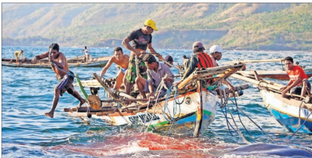
Los lamaleros remolcan una ballena muerta, en Lamalera (Indonesia).

Al leerlo, puede que se lllore por las ballenas. Pero también, por ellos.