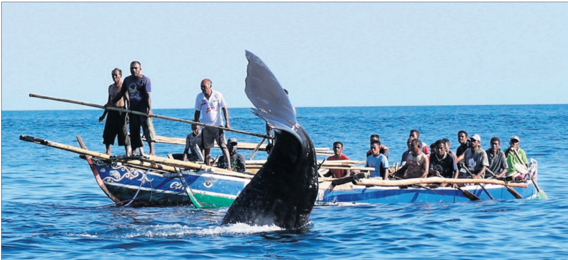
Una ballena se defiende de los arponeros de una tribu de Lamalera (Indonesia).

El estadounidense Doug Bock Clark narra en un libro la lucha de una tribu de Indonesia por sobrevivir a la globalización