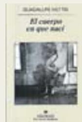
EL CUERPO EN QUE NACÍ... Autora: Guadalupe Nettel Ensayo. Editorial: Anagrama. Páginas: 196. Precio: 16 euros