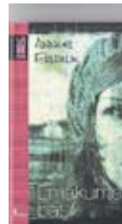
EMAKUME BAT Egilea: Annie Ernaux. Nobela. Txalaparta argitaletxea. 91 orrialde. 14,00 euro.

Pasadizoak, amaren historia, argazkiak dira irakurlearen aurrean, eta, hasiera batean, nahiko efektu hotza uzten du, idazlearen narratzeko eragatik. Baina urrun-tasan hori ongi landutako efektua da, harremanaren benekotasuna, eta esango nuke, sentsibilitatea, agerian geratzen baitira. Nobelaren laburrak, irakurketa azkar batera eramaten zaitu, baina era berean, azterketa soziologiko bikaina eskaintzen du, gizarte oso bat txertatzen baita.