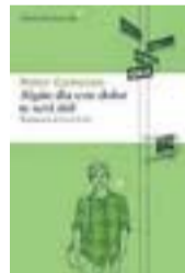
ALGÚN DÍA ESTE DOLOR TE SERÁ ÚTIL Autor: Peter Cameron. Trad.: Jordi Fibla. Editorial: Libros del Asteroide. Páginas: 246. Precio: 18,95 euros

'Algún día este dolor te será útil' es una estupenda lectura que conmueve e inquieta, porque palpita de esas emociones inciertas que acompañan el rito de paso a la adultez.