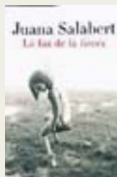
LA FAZ DE LA TIERRA Autor: Juana Salabert Autobiografía. Editoria Alianza Páginas: 249 Precio: 17,50 euros.

Muñoz Rengel ha escrito una novela de lectura ligera y divertida, aunque quizás los capítulos dedicados a literatos y pensadores sincopan la cadencia del relato principal. Rebosa humor absurdo, crea un personaje que de tan grotesco alienta la ternura, y entretiene de principio a fin. I. U.