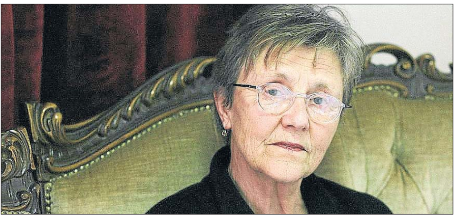
La escritora y periodista australiana Helen Garner.