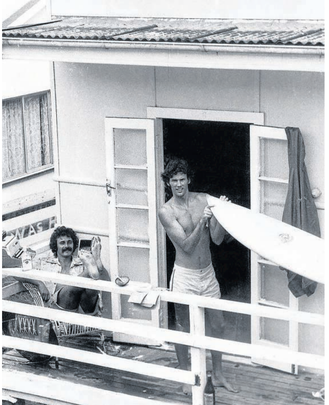
El periodista y escritor William Finnegan con la tabla de surf y un amigo, antes de ir al mar.