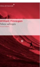
Años salvajes William Finnegan Libros del Asteroide 600 págs. 26,95 €.

Uno no puede sino sentir envidia por haberse perdido tantas olas extraordinarias y, a la vez, un inmenso placer por acompañar a Finnegan buscando tesoros en las playas. La lectura de este libro es de las que te ensanchan la vida. ●