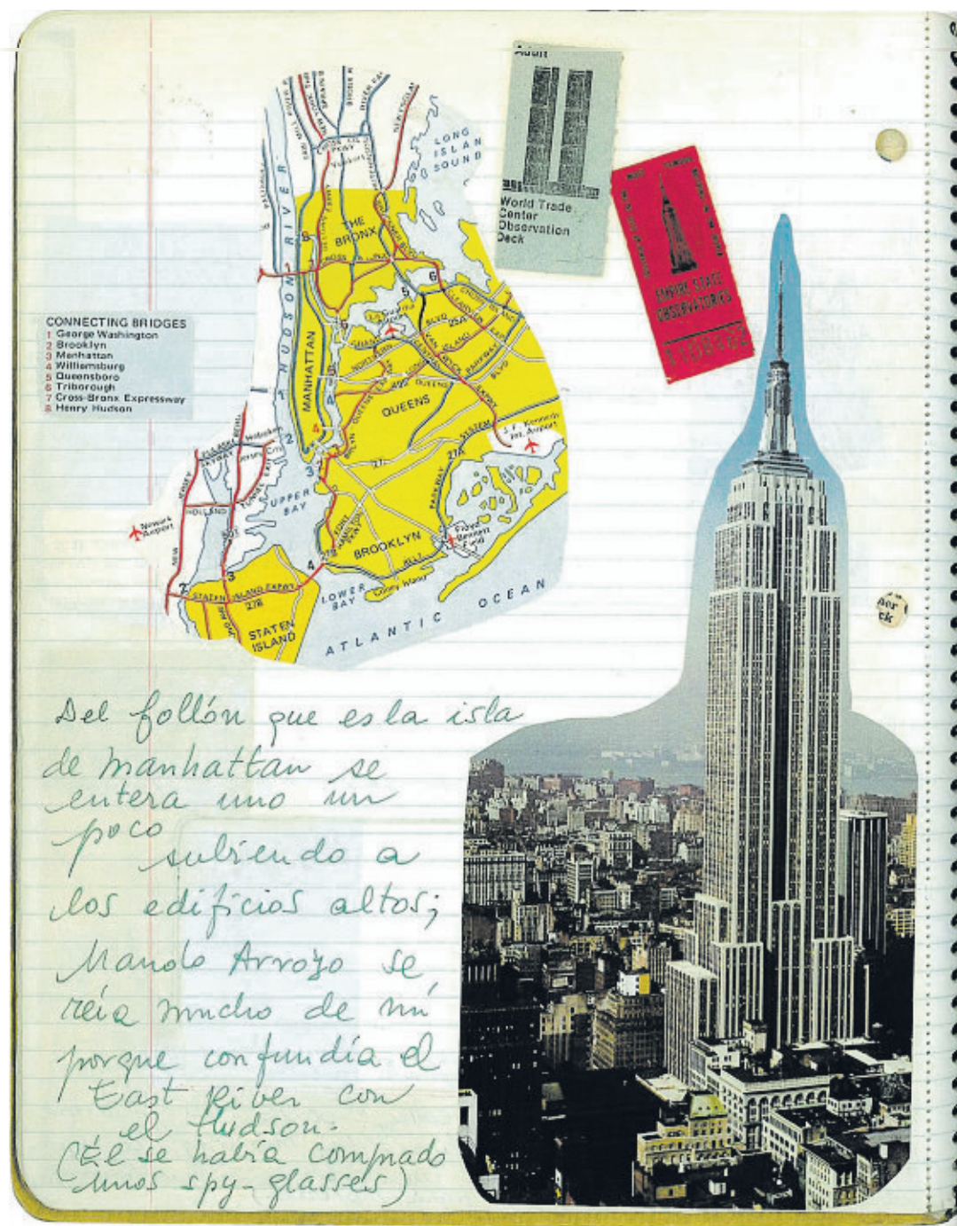
EL FOLLÓN DE MANHATTAN La representación del espacio, mapas y edificios abundan en las anotaciones de 'Visión de Nueva York'