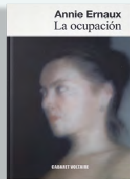
La ocupación Annie Ernaux Cabaret Voltaire 96 páginas / 16,95€

Cuando a comienzos del actual milenio la autora de origen canadiense afincada actualmente en París publicó esta obra, rescatada ahora por Libros del Asteroide, se generó una polvareda considerable, e incluso un columnista llegó a reclamar a los servicios sociales que se hicieran cargo de las hijas de la autora. Este sincero y ejemplar análisis personal "sobre la experiencia de ser madre" aborda la maternidad desde todos los ángulos posibles, incluso desde esos que a nadie les gusta exponer públicamente pero son tan necesarios como las bondades de esta experiencia vital irreplicable. La libertad, los sueños, las ilusiones, el amor, los límites de la entrega al ser querido... Cusk aborda la cuestión sin remilgos ni paños calientes en una obra necesaria y conmovedora, tanto como sincera e incluso incómoda. dlb