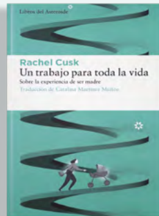
Un trabajo para toda la vida Rachel Cusk Libros del Asteroide 224 páginas / 18,95€

Stephen Dixon, escritor neoyorquino fallecido en 2019, deja una importante carrera literaria reconocida con numerosos premios. Tanto es así que, pese a ser aún bastante desconocido en España, el autor de obras como Interestatal o Historias tardías llega a ser aupado como maestro de escritores y pionero en su momento de eso tan de moda hoy que se llama autoficción literaria. En Gould. Una novela en dos novelas presenta a un joven en el Nueva York de los años 50, que se dirime en un mar de dudas para acometer adecuadamente las reglas del cortejo, solventadas poco a poco con la llegada de la tempestuosa década de los 60 en cuanto a relaciones interpersonales se refiere. Un juego inteligente de perspectivas con una estructura narrativa asombrosa que permite el fluir de una literatura excelsa, sólo accesible a unos pocos maestros de maestros. Dixon es uno de ellos. ¡Y aún casi desconocido! dlb