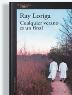
Cualquier verano es un final Ray Loriga Alfaguara 248 páginas / 19,90€

Qué hubiese sido de uno de los grandes escritores contemporáneos sin el arduo, constante y perfeccionista trabajo del catedrático de letras clásicas Bernard de Fallois, que a principios de la década de los 50 del pasado siglo descubrió los manuscritos de Jean Santeuil y Contra Sainte-Beuve , del también creador de la saga universal de En busca del tiempo perdido . Explica Pierre Assouline que estas siete conferencias magistrales del insigne estudioso de la obra proustiana resumen a la perfección los grandes ejes temáticos de una de las obras literarias más importantes de todos los tiempos. Fallois se adentra en los personajes creados por Proust, analiza su manera de abordar lo cómico, el arte, la metafísica, el amor y todos aquellos temas que conforman las siete partes de À la recherche . dlb