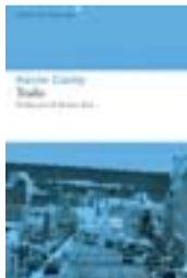
TODO Autor: Kevin Canty Trad.: Damiá Alou Edit.: Libros del Asteroide. 7300 Precio: 18,95 euros

Personajes de carne y hueso, rebosantes de autenticidad, con sus angustias y anhelos, que no renuncian a vivir de otra manera. Se resisten a la falta de amor y pugnan con tesón porque quizás no sea aun demasiado tarde para que tras las tinieblas haya luz. Combatientes mientras haya vida para mejor vivirla.