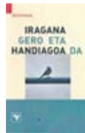
IRAGANA GERO ETA HANDIAGO DA Egilea: Askoren artean. Aforismoak. Utriusque Vasconiae argitaletxea. 150 orrialde.

ka eta ezaugarriak agertzen dira. Arestian aipatu dut hitz gutxiko diskurtsoa eraikitzearen zailtasuna, baina aforismo hauek, liburuan agertzen direnak, kontrakoa erakusten dute. Perla ederrak daude; ironia, pentsamendu sakonak, paradoxak... denetarikoa adibideak aurkituko ditu irakurleak. «Ohi-kotasunak estu egiten digu existentzia». «Hegoak ebaki, hegoak, hegoa, Egoa... hago!» «Begiak esaten digute ahoak isildu ezin duena». «H-a existitzen ez dela zeina hotsek ukatu behar dit niri?». «Gaueko isiltasunak biltzen ditu hitzik gabeko pentsamenduak». «Mingaina gogoeten atezaina». «Desberdina da bizitzan galduta egon eta Utriusque Vasconiae bizitza esploratzen aritzea». «Mantsoena ezepe da, baita gogorrena ere». Irakurle, liburuko lagin bat izan da hau. Orain guztiak hartu, irakurri eta busti hitzen artean. Ez zarete damutuko. Ariketa hor dago.