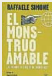
EL MONSTRUO AMABLE Autor: Raffaele Simone. Trad. Alejandro Pradera. Ensayo. Editorial: Taurus. 189 páginas. Precio: 18 euros

El argumento de este lingüista italiano señala el fracaso de la izquierda en su afán por remodelar la sociedad, el declive de las convicciones que la caracterizan y el lastre del comunismo. Frente a esta situación de inoperancia efectiva, la neodercha se dibuja como