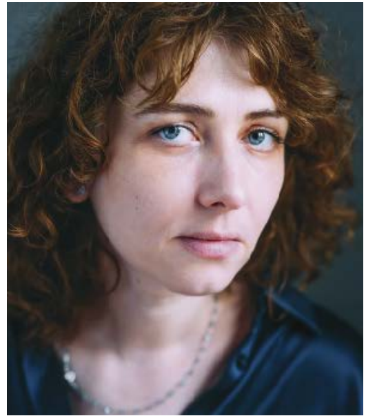
Starobinets (Moscú, 1978) gusta tanto a puristas como a profanos

Avalada por los más estrictos puristas y a la vez disfrutable por una audiencia mucho más amplia, Starobinets propone originales vueltas de tuerca a temas que son un poco los de siempre, viajes en el tiempo, andróides