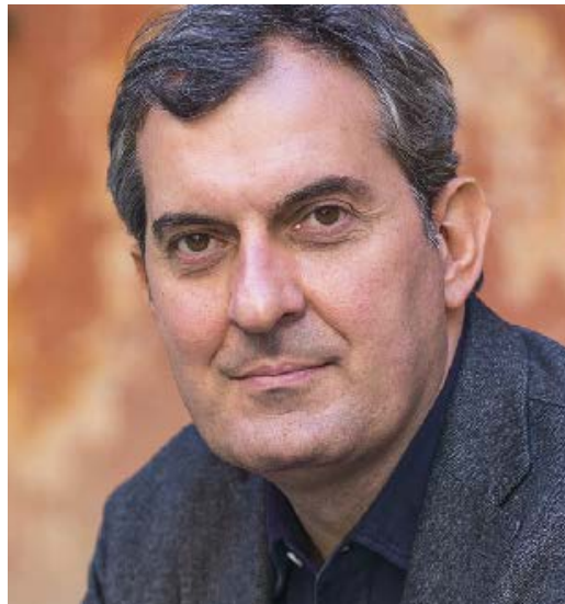
Mario Calabresi ha dirigido periódicos como La Stampa y La Repubblica

Dario Fo, siempre tan reivindicativo, contribuyó artísticamente fijando en el inconsciente colectivo las apócrifas circunstancias de la muerte de Pinelli. Y poniendo una diana a Calabresi, señalándolo como objetivo. En el prólogo de Muerte accidental de un anarquista (en mi ejemplar de Pepitas), el intelectual de referencia de la izquierda italiana asegura: "Había que hacer ruido, de todas las formas posibles para que la gente que anda siempre distraída, que lee poco y mal, supiera de qué manera el Estado es capaz de organizar la masacre".