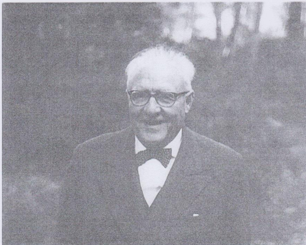
El periodista y escritor en un retrato fechado en 1962

Fue el mayor periodista de su generación, cronista de la Primera Guerra Mundial, director de ‘La Vanguardia’, ideólogo de la relación entre Catalunya y España... A los cincuenta años de su muerte, Agustí Calvet es una referencia imprescindible de la cultura liberal del siglo XX. Revisamos su figura a través de sus paisajes