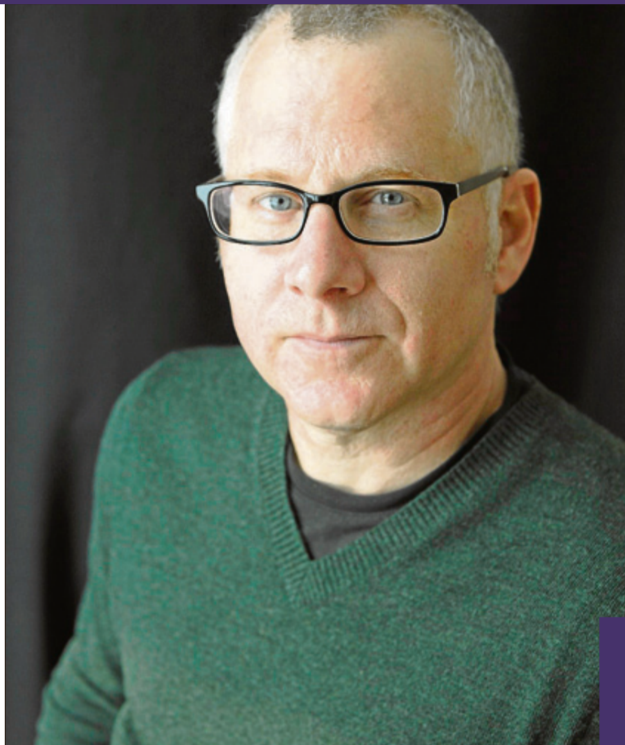
El escritor norteamericano Tom Perrotta LIBROS DEL ASTEROIDE

De cualquier modo, lean esta novela, ya que es magnífica y muy divertida en forma y fondo y yo no esperaré a decepcionarme con una reducción a risas enlatadas.