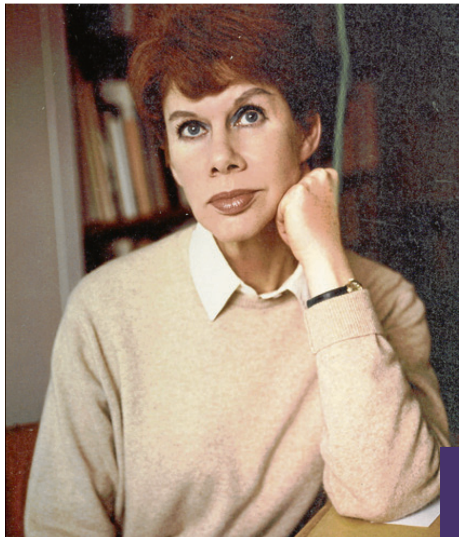
La escritora británica Anita Brookner.

A pesar de que Ruth Weiss tiene una existencia marcada por la melancolía, soledad, la tristeza, o la ausencia de unos padres que ejercen como tales, el tono irónico que le imprime Brookner a este texto provoca en el lector menos pena de la que a priori la desgraciada vida de la doctora pudiese dar. Este estilo tragicómico precisamente le imprime su característica más representativa, pues aunque empatizas con su personaje no te llegas a compadecer de su fatal destino.