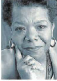
Maya Angelou. ASTEROIDE

A los siete años fue violada por el novio de su madre. Se lo contó a su hermano,